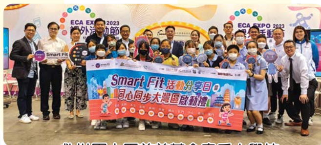
救世軍中原慈善基金皇后山學校