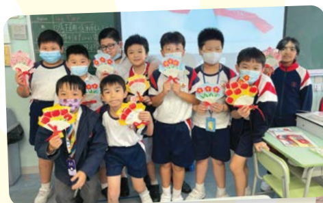
救世軍中原慈善基金學校