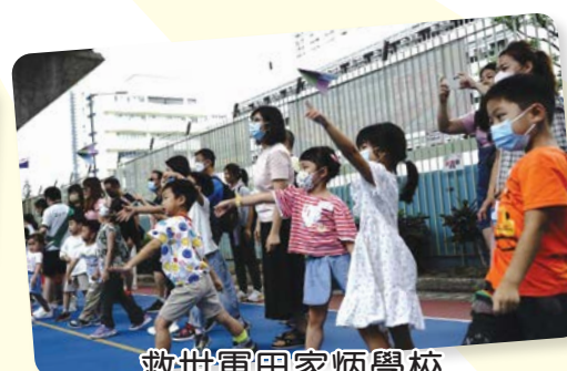
救世軍田家炳學校