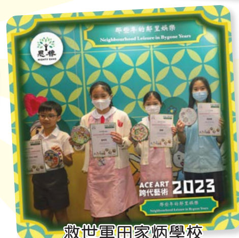
救世軍田家炳學校