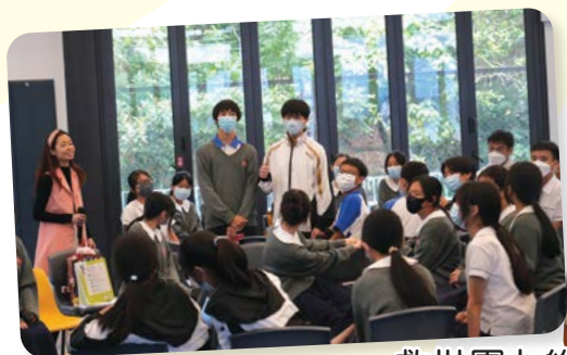
救世軍卜維廉中學