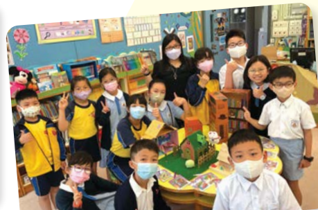
救世軍韋理夫人紀念學校