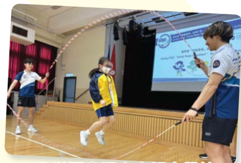
救世軍韋理夫人紀念學校