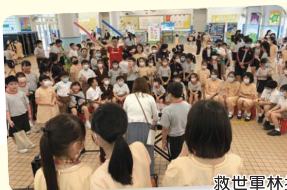
救世軍林拔中紀念學校