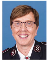
柏羅麗莎中將 Rosalie Peddle Commissioner

我們過靈命覺醒的生活。有了更新的信仰並藉聖靈的幫助，我們定能排除面前的障礙，我們定能掙脫撒旦加諸我們身上的枷鎖，重獲自由，憑着信心得勝向前邁進！不要再讓自己的失敗掩蓋神在我們生命中所作榮耀的事，每日經歷神的同在，把我們的心意放在天國之上。