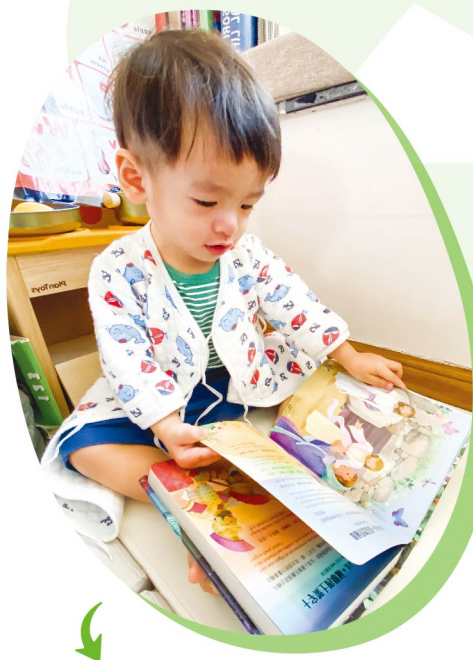
區姊妹的環保婚禮物資店正如一個小生命，正在逐步成長。圖為區姊妹的孩子。

其實我們每位弟兄姊妹都有各自的使命，在職場工作也好，任何崗位也好。在別人眼裏，踏足綠色婚禮行業可能是不知從何而來的傻勁和衝動，但我心裏相信，這也算得上是神給我的另類使命。一如所料，環保婚禮物資店由零開始出發，再次