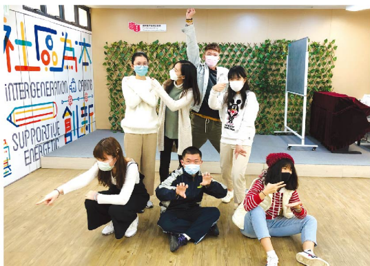
■ 第一年課堂的練習片段。