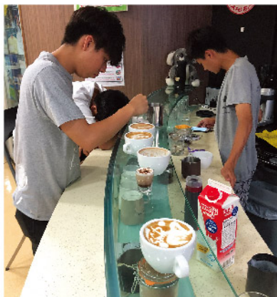
■ 咖啡拉花減壓體驗