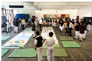
■ 學校「放·空間」地壺球初體驗