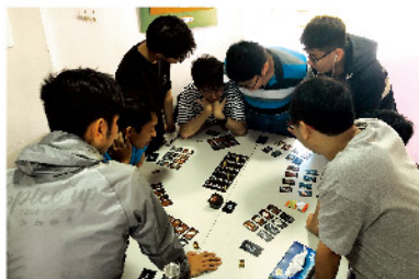
■ 桌遊放空減壓小組