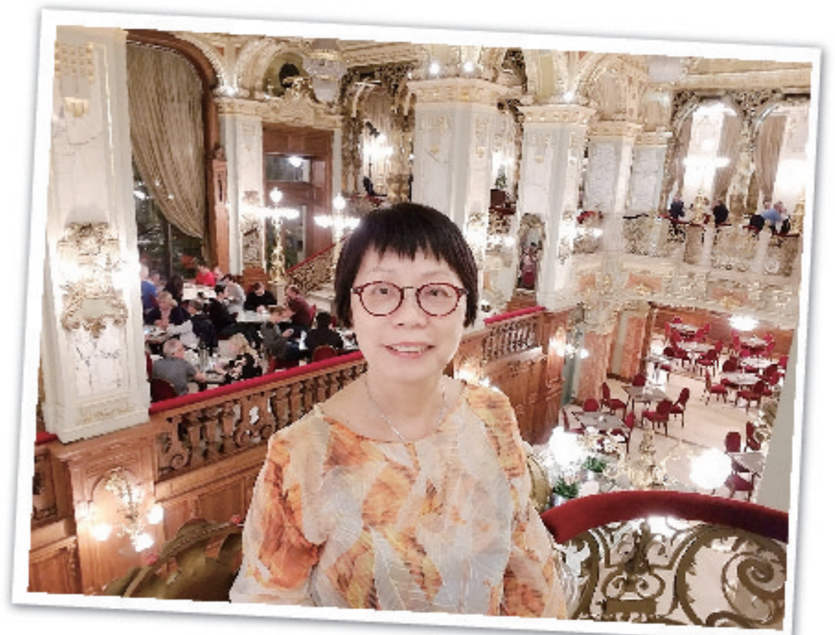
文章整理：林映雪

本身從事精神科社工的素芳，工作時接觸了很多個案，了解精神健康的重要性。她表示「開心」和「不開心」很多時只是一念之間，若執着不如意之事，不斷鑽牛角尖，會徒增苦惱；如能轉換角度思考和學習正面思維，從痛苦黑暗中找點亮光，又或與之共存，這樣在面對逆境時也會輕省一些。她特別鼓勵信徒在困難中要依靠神，常常數算神的恩典，也要捉緊神的應許，明白神讓我們經歷的必定有祂的心意，因喜樂的心乃是良藥，而主的恩典夠用，與弟兄姊妹共勉之，將一切榮耀歸與父神。 S