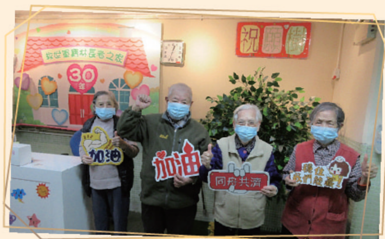
院舍長者為各位守護長者的員工及醫護人員打氣！

面對來勢洶洶的疫情，誰會不膽怯、不憂慮呢？就着院友在靈性上的需要，我們善用與疫情相關的禱文，每天和院友一同在禱告中互相打氣，提醒我們神應許賜我們平安，讓我們面對任何試煉時都可以堅強站立。因着禱告，我們心裏感到平安。