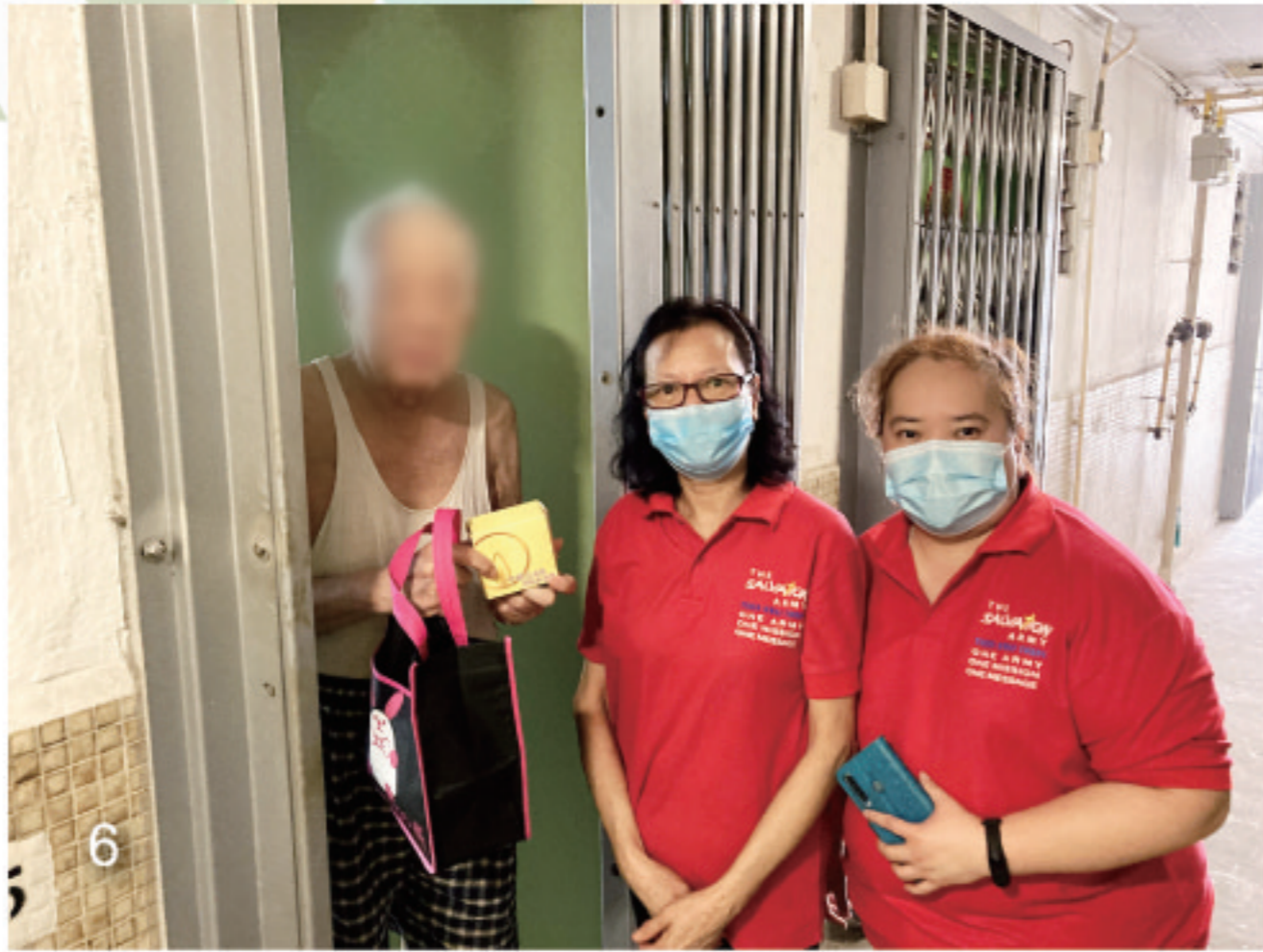
6-7. 荃葵隊 Tsuen Kwai Corps