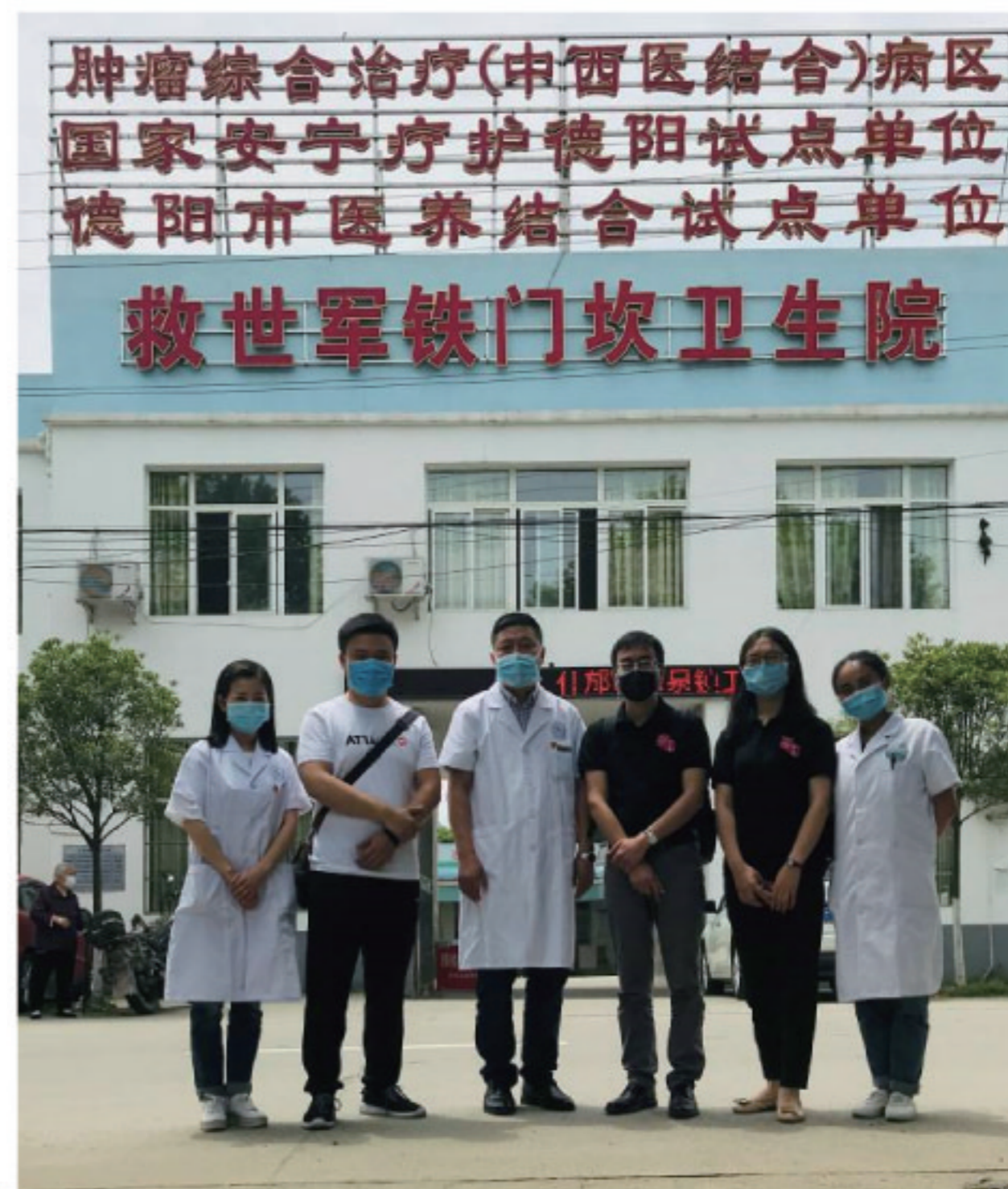
救世軍鐵門坎衛生院安寧療護團隊成員與救世軍員工合影

做患者生命中最後一道彩虹，讓生命的最後不止於冰涼，更有溫情。南泉鎮衛生院安寧療護中心就是這麼一直在努力着。他們正一步步努力讓臨終關懷成為常態，讓臨終關懷不再是奢侈。 S