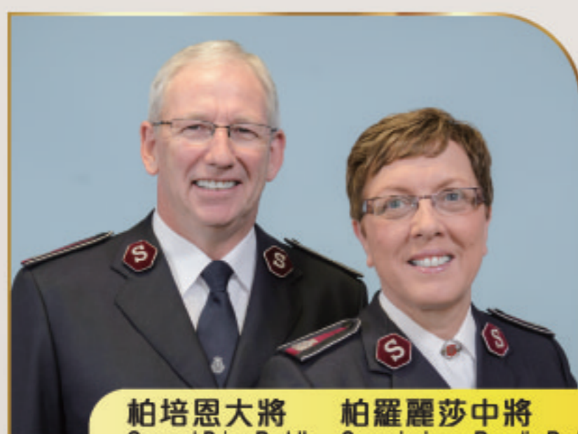
柏培恩大將 General Brian Peddle