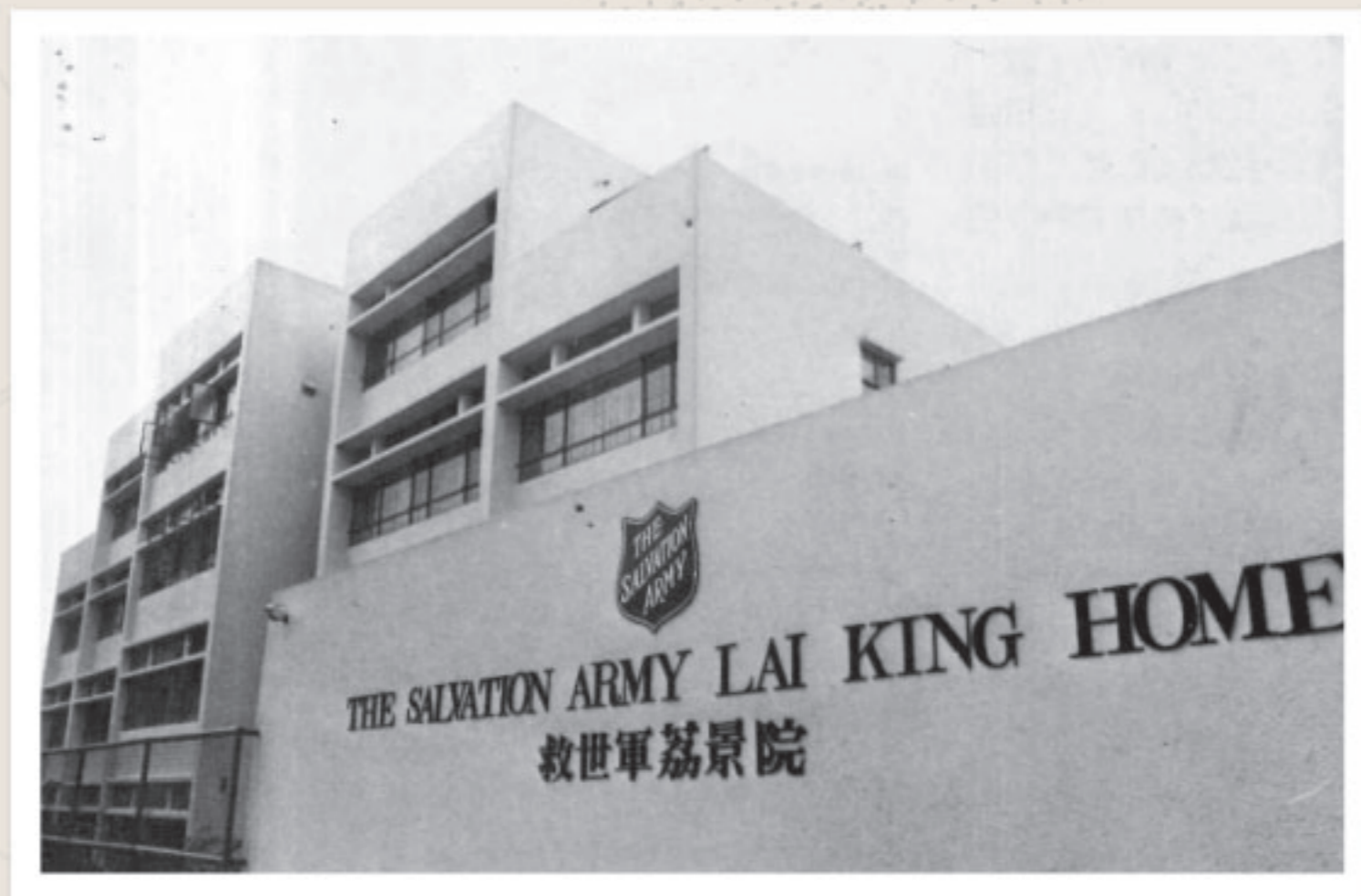
荔景院為智障兒童及青少年提供服務