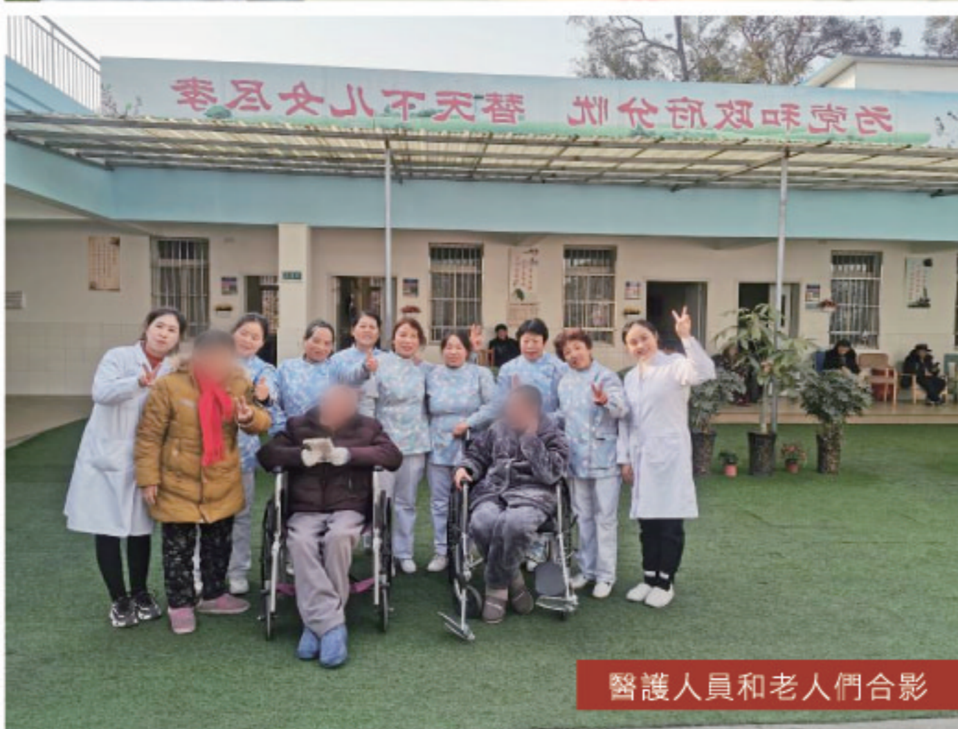
醫護人員和老人們合影