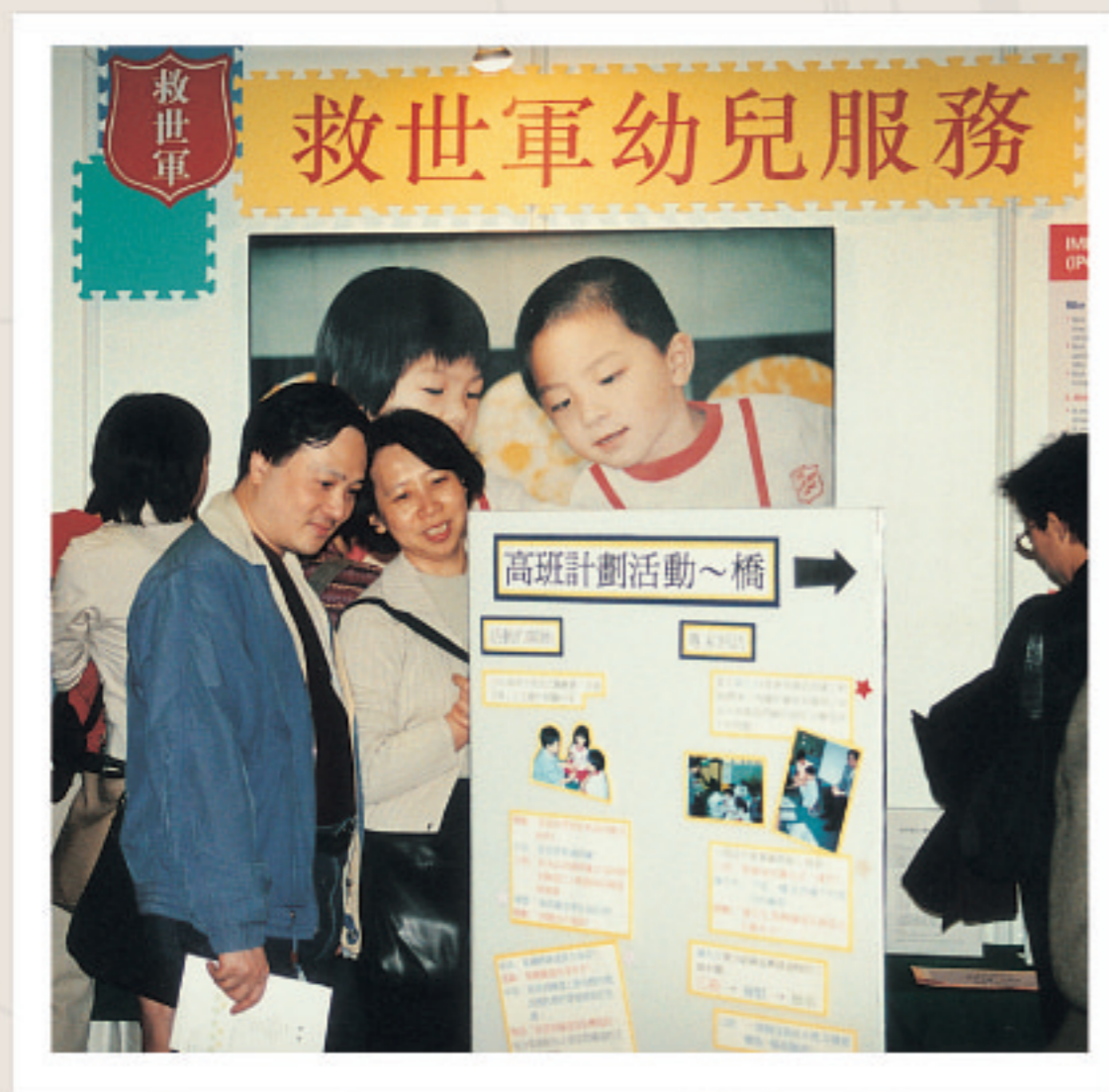
↑ ← 1980年代，救世軍的服務已很多元化，由嬰幼兒至長者也有。