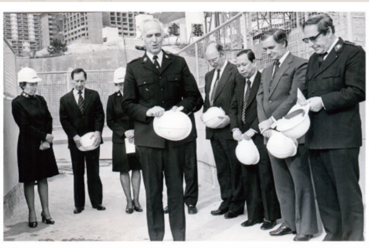
1979年3月荔景院平頂儀式及奉獻祈禱

服務範疇擴展之外，社會服務部員工亦致力策劃富彈性的服務，以及嘗試創新服務。舉例來說，1979年落成啟用的荔景院便是一座集合特殊學校、職業訓練中心和院舍的大樓，為百多名智障兒童及青少年提供服務，當時是香港唯一一所同類設施。