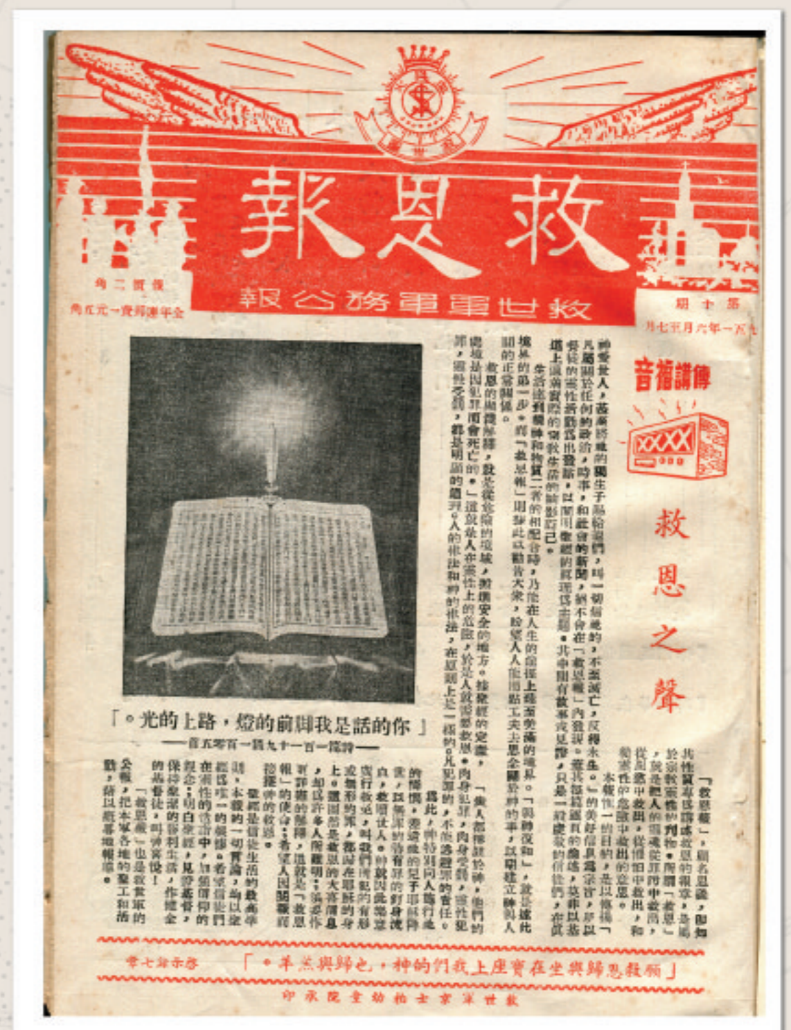
現存香港最早期的救恩報，於1951年6月出版。當年的救恩報由京士柏幼童院承印。

此外，又翻譯和出版本軍屬靈領袖的著作，如班克魯的《等候神》、史諾拔的《蒙召作神的子民》、史卓德的《打開聖潔》等，陶造軍兵屬靈生命。文字書籍以外，詩歌集也是本軍的重要出版。黃少校任職文字部長期間，便曾修訂及再版《救世軍詩歌》，那時更特別增設專門負責整理詩歌集的職位，可見本軍對這方面的重視！