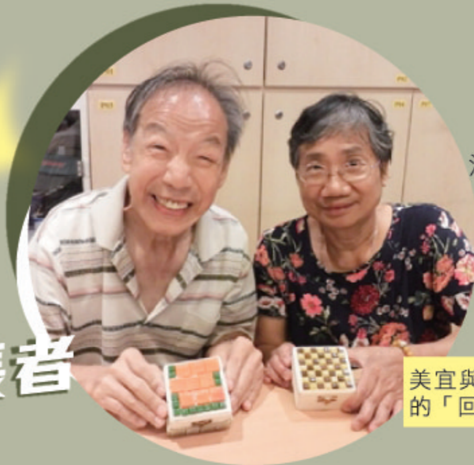
余家傑社工 油麻地長者社區服務中心