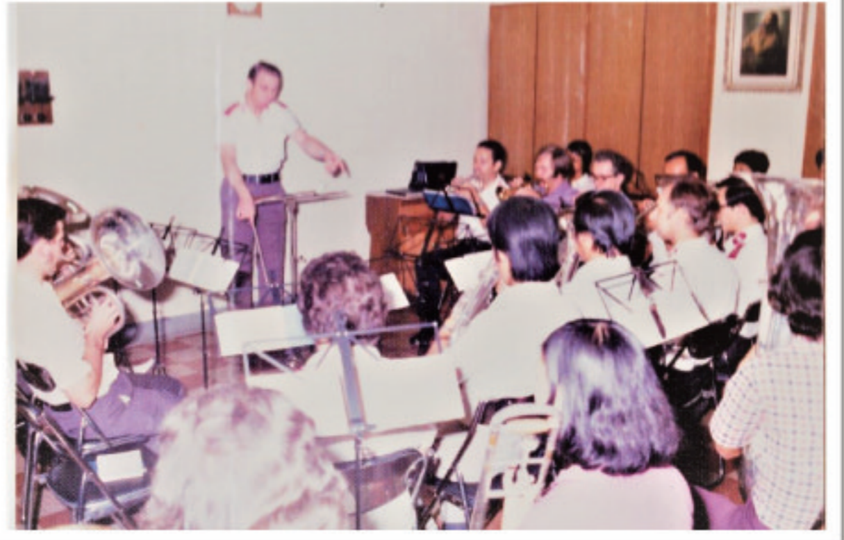
當年總部樂隊每星期三晚上於總部練習的情形。