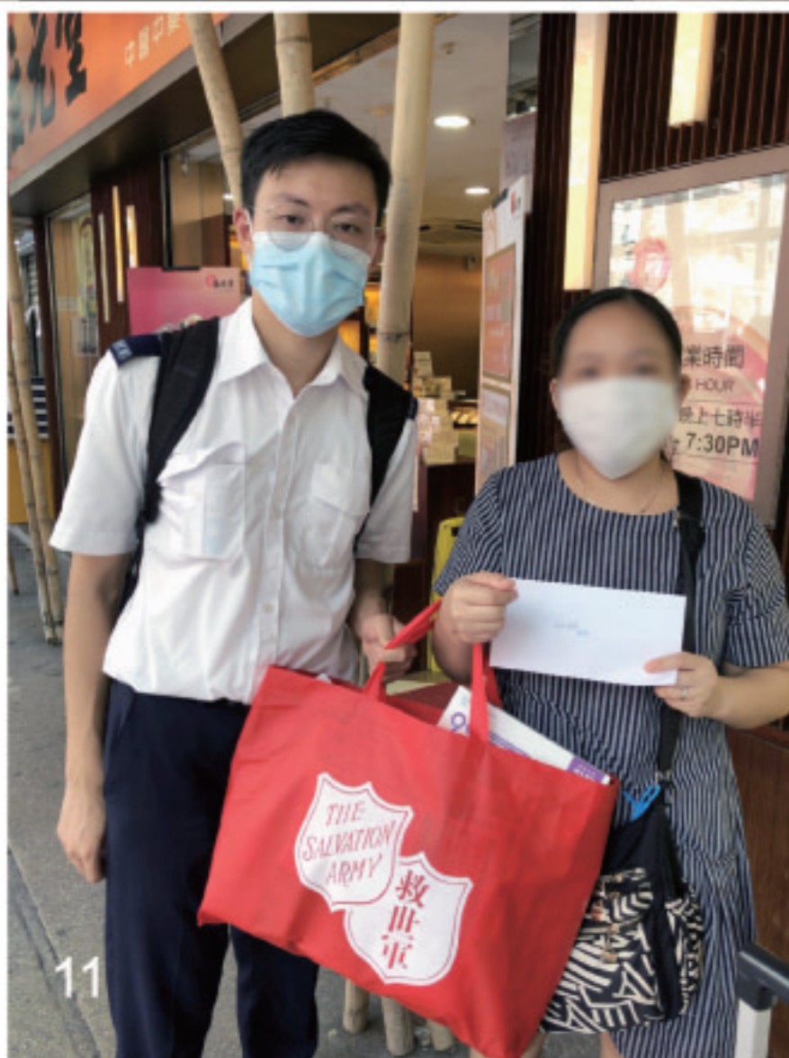
7-8. 沙田隊聯同隆亨青少年中心探訪和贈送防疫物資予隆亨邨獨居長者。 Shatin Corps and Lung Hang Children and Youth Centre visited and gave out anti-epidemic items to elderly living alone in Lung Hang Estate.