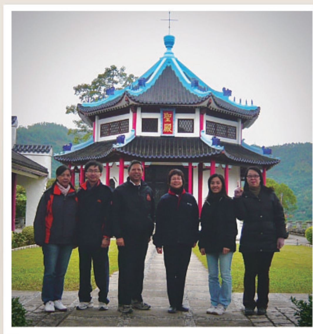
馬少校帶領學員參與每月一次的靈修日。

而附屬於軍官訓練學院的領袖培訓中心，則會向現任軍官、部隊幹事、軍兵提供屬靈及與服侍崗位有關的訓練。學院又附設小型圖書館、檔案室及展覽室，讓軍兵及同工們前來使用。今年九月，兩位來自卜維廉隊的軍兵正式成為學員，接受軍官訓練。願神賜福我們的軍官訓練學院及領袖培訓中心，在香港造就祂所重用的僕人。 S