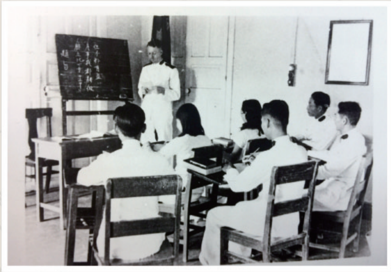
1 華南軍區第一屆學員上課情形

軍 官(牧師)培訓是全球救世軍傳統中的重要環節之一，由於救世軍強調「心向神 手助人」的精神，因此軍官除了需要接受傳統神學院式的栽培外，亦需要有一套切合救世軍服務人群所需的訓練。要追溯港澳軍區軍官培訓的歷史，則需要參考救世軍在中國及香港之發展歷史。