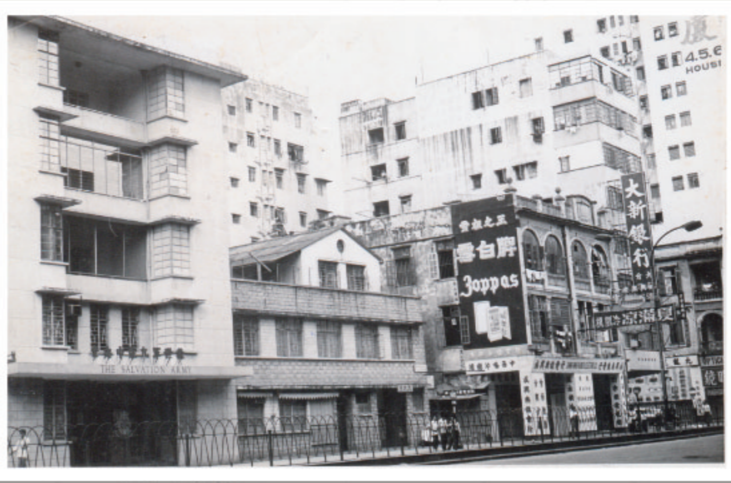
九龍中央堂於彌敦道的舊址