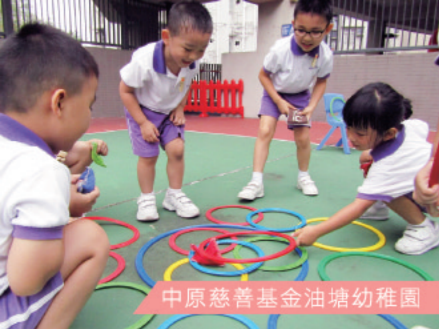
中原慈善基金油塘幼稚園