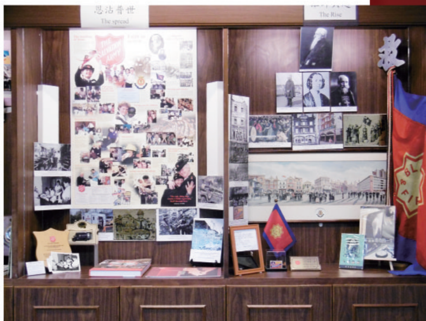
正在籌備中的文物展示室