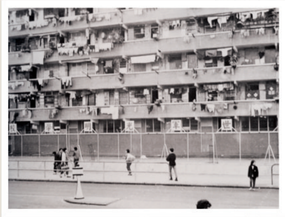
位於徙置區的救世軍光明學校外貌。