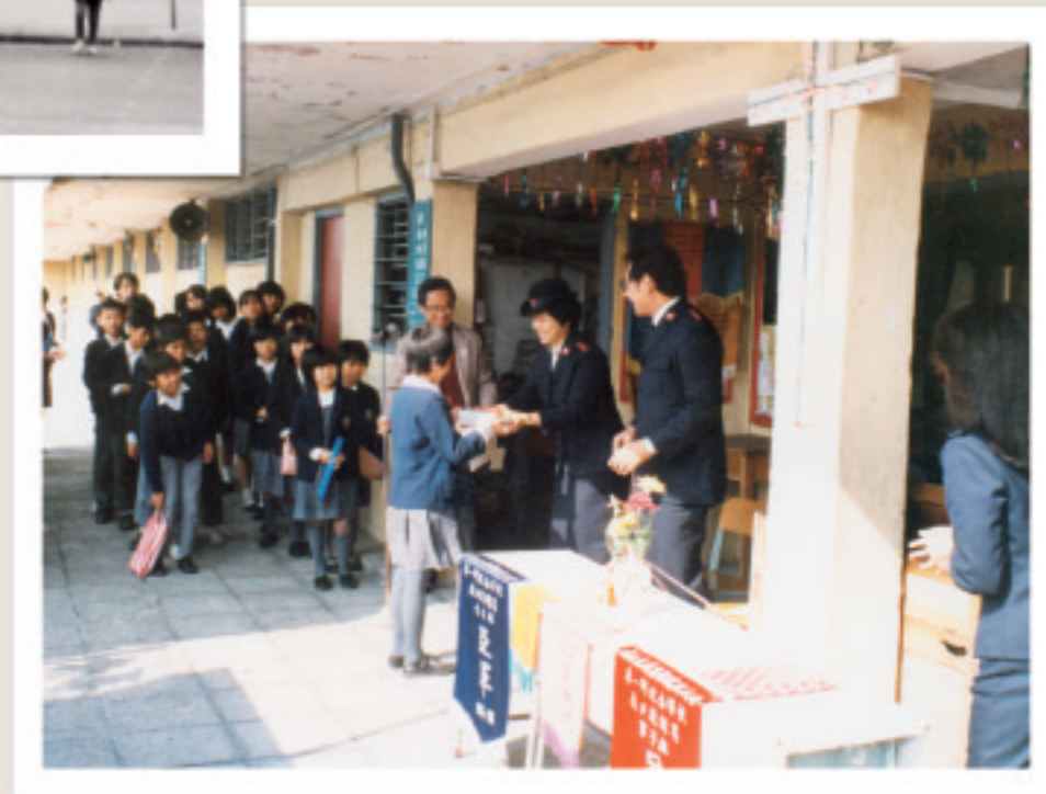
隨着光智小學於1987年結業，救世軍完成了天台辦學的使命。

光明學校的學生大多來自區內的基層家庭，他們都很受教，也很用功。魯校長記得有一位學生在升中試中考獲中文和數學一級、英文二級的佳績，稱得上是今日的「狀元」，結果這位學生能繼續升學，後來更當上律師。當年如升中試成績欠佳，未能升讀官校或津校，又負擔不起私校的學費，便要輟學。