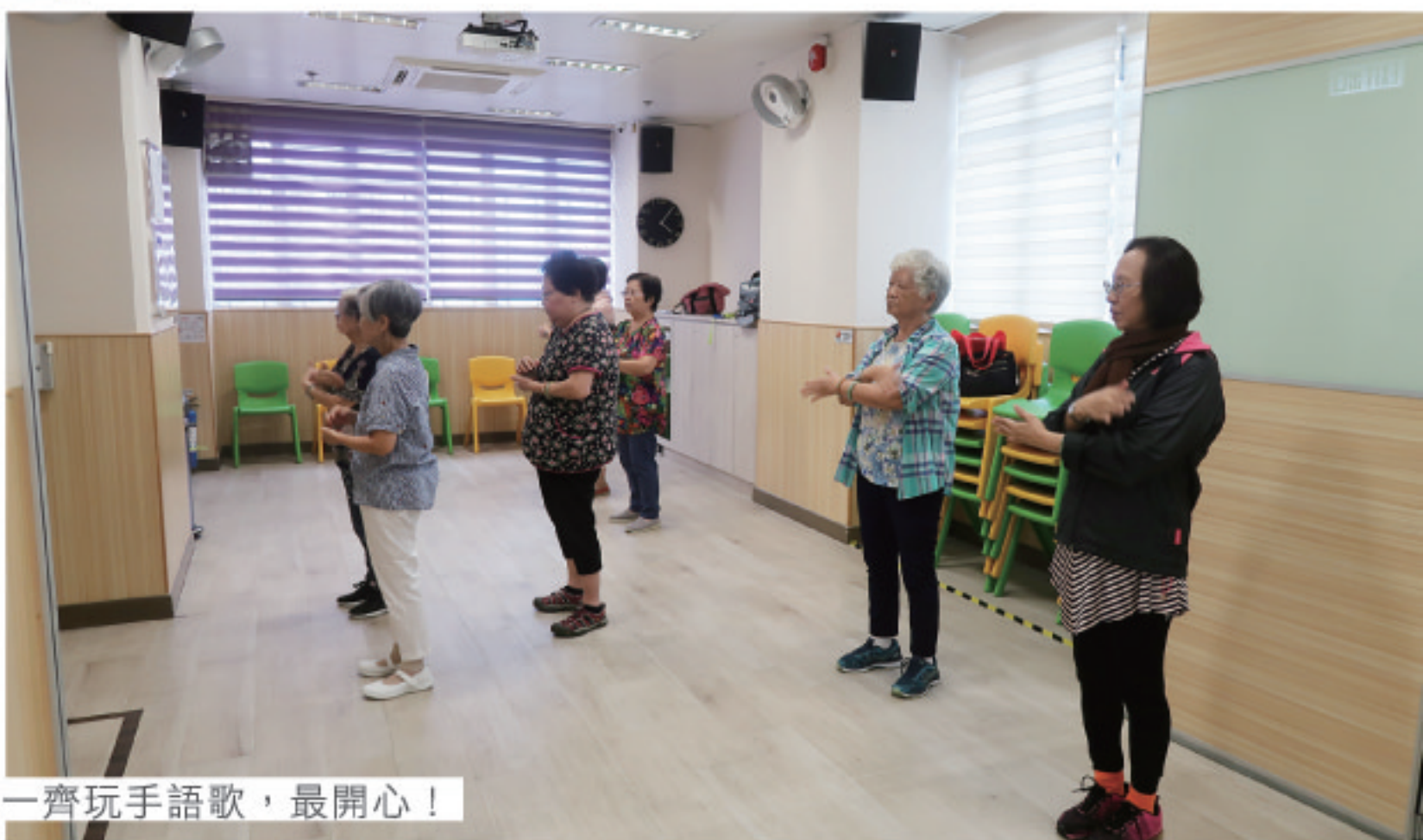
一齊玩手語歌，最開心！