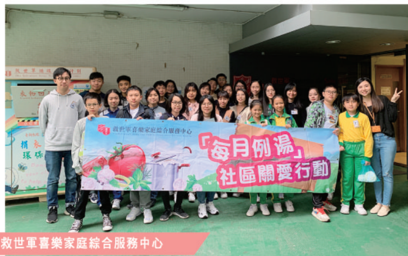
救世軍喜樂家庭綜合服務中心

於2013年開始正式投入服務，中心坐落於澳門人口最稠密的北區，現時該區約有24萬人居住。中心服務以家庭為基礎，服務對象包括兒童、青少年、家長和長者等，並以「愛」與「綠」為服務理念，為社區人士提供多元化服務，以實踐「健康人生、綠色生活、關懷鄰里、放眼社區」的生活模式，期望建立一個有溫度的社區、有笑聲的家庭及有濃度的生命。