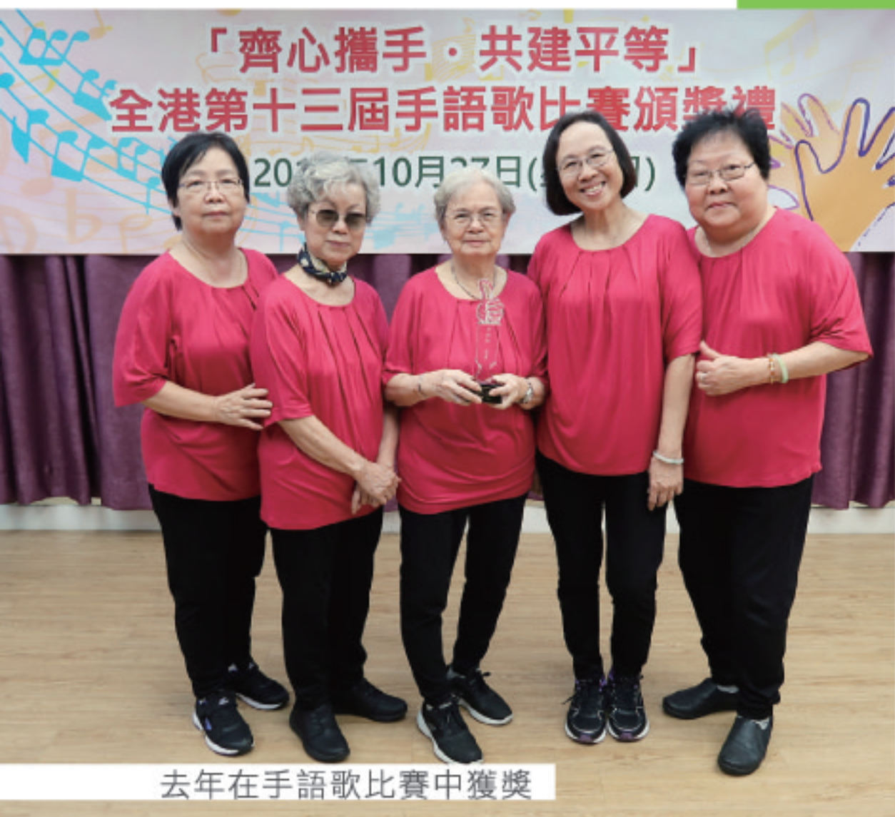
去年在手語歌比賽中獲獎