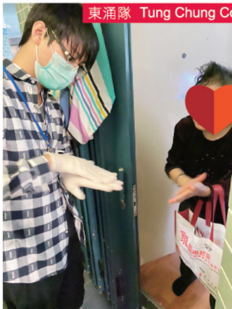
東涌隊 Tung Chung Corps