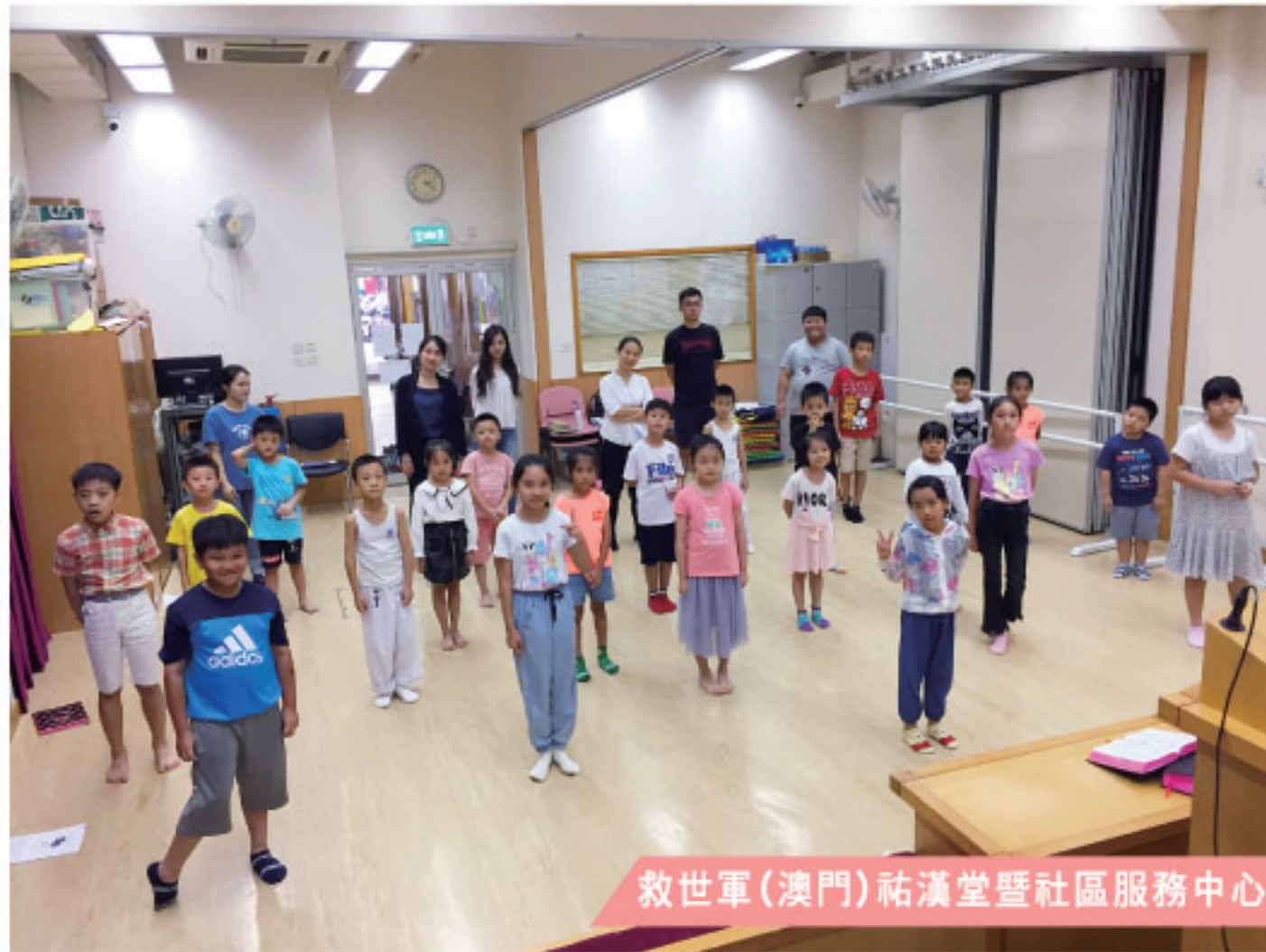
救世軍(澳門)祐漢堂暨社區服務中心