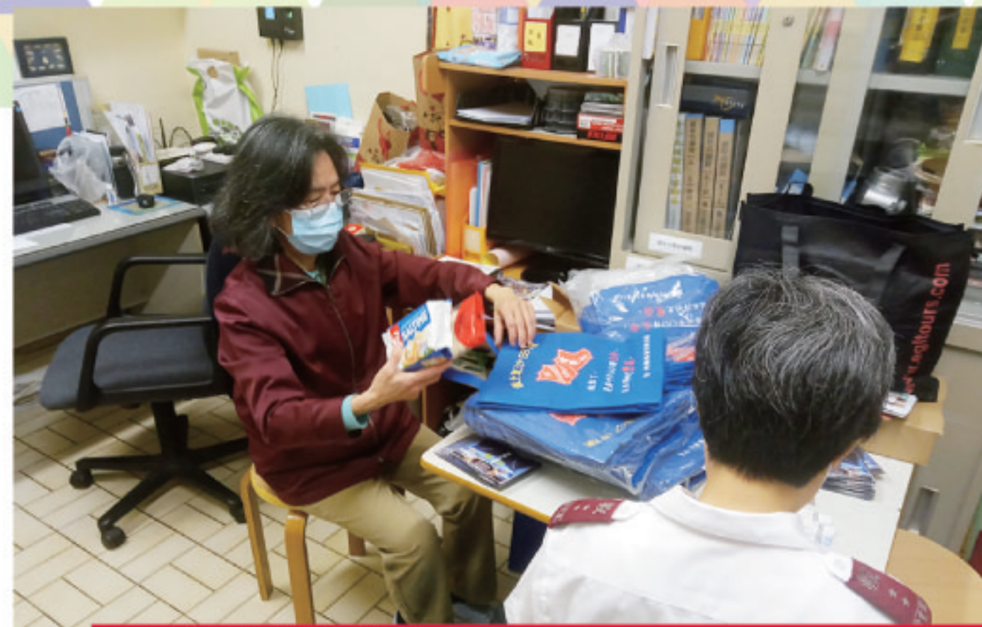
沙田隊及隆亨青少年中心 Shatin Corps and Lung Hang Children and Youth Centre

As the novel coronavirus is still raging, Corps Officers and comrades of various Corps joined hands with colleagues and volunteers of the educational services and social services units in the chaplaincy district. Serving together as one with love, they delivered surgical masks, hand sanitisers, food and other daily necessities to immobile elderly, families and students in need, showing them their care and sharing with them the grace of God. Some of the elders were grateful as they were short of surgical masks. We extend our gratitude to the generosity from our supporters, which has enabled us to serve even more people.