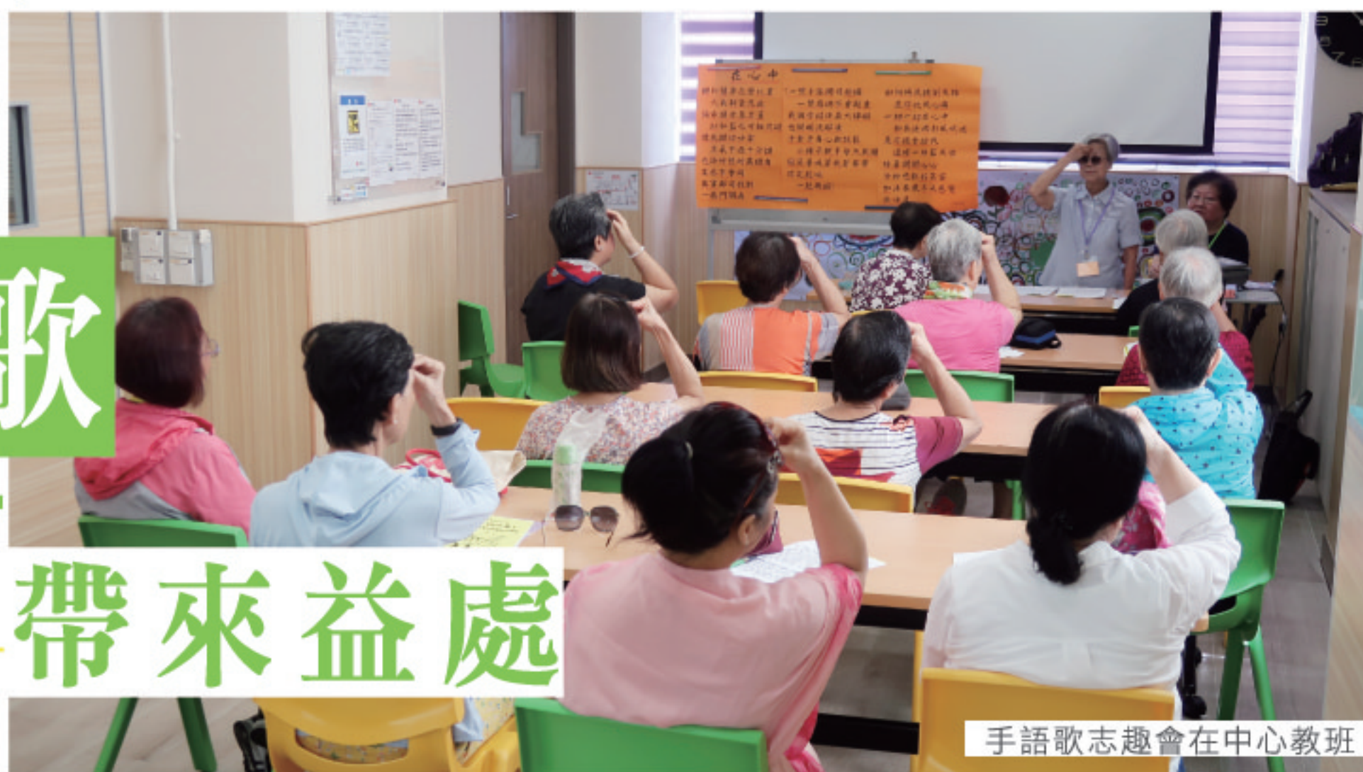
手語歌志趣會在中心教班

這 天，救世軍海嵐長者中心的課室傳來歡愉的音樂聲，一班長者正在手舞足蹈，不過他們並不是學習跳舞，而是在練習手語歌。