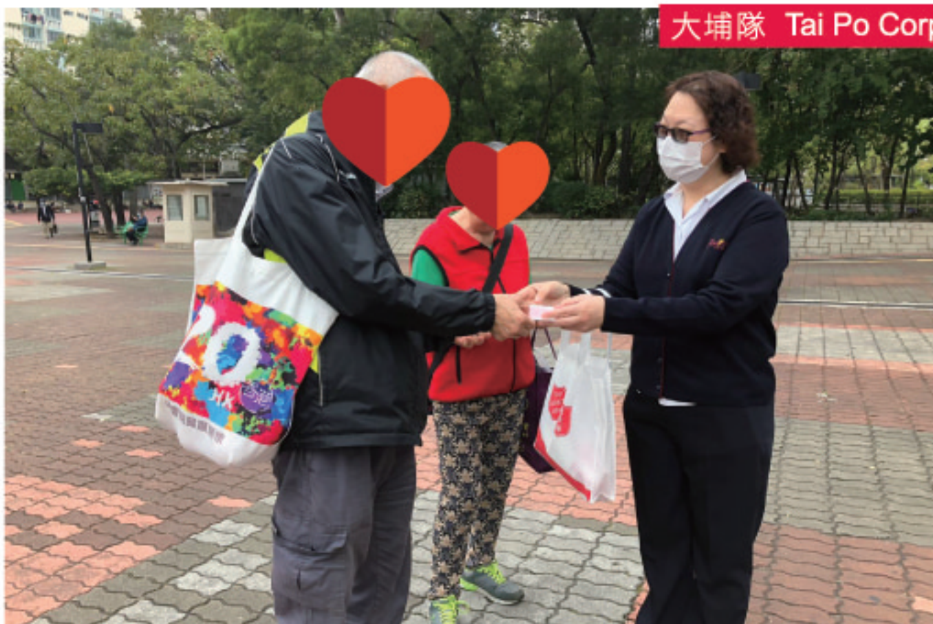
大埔隊 Tai Po Corps