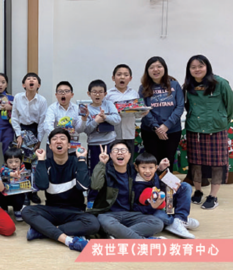
救世軍(澳門)教育中心