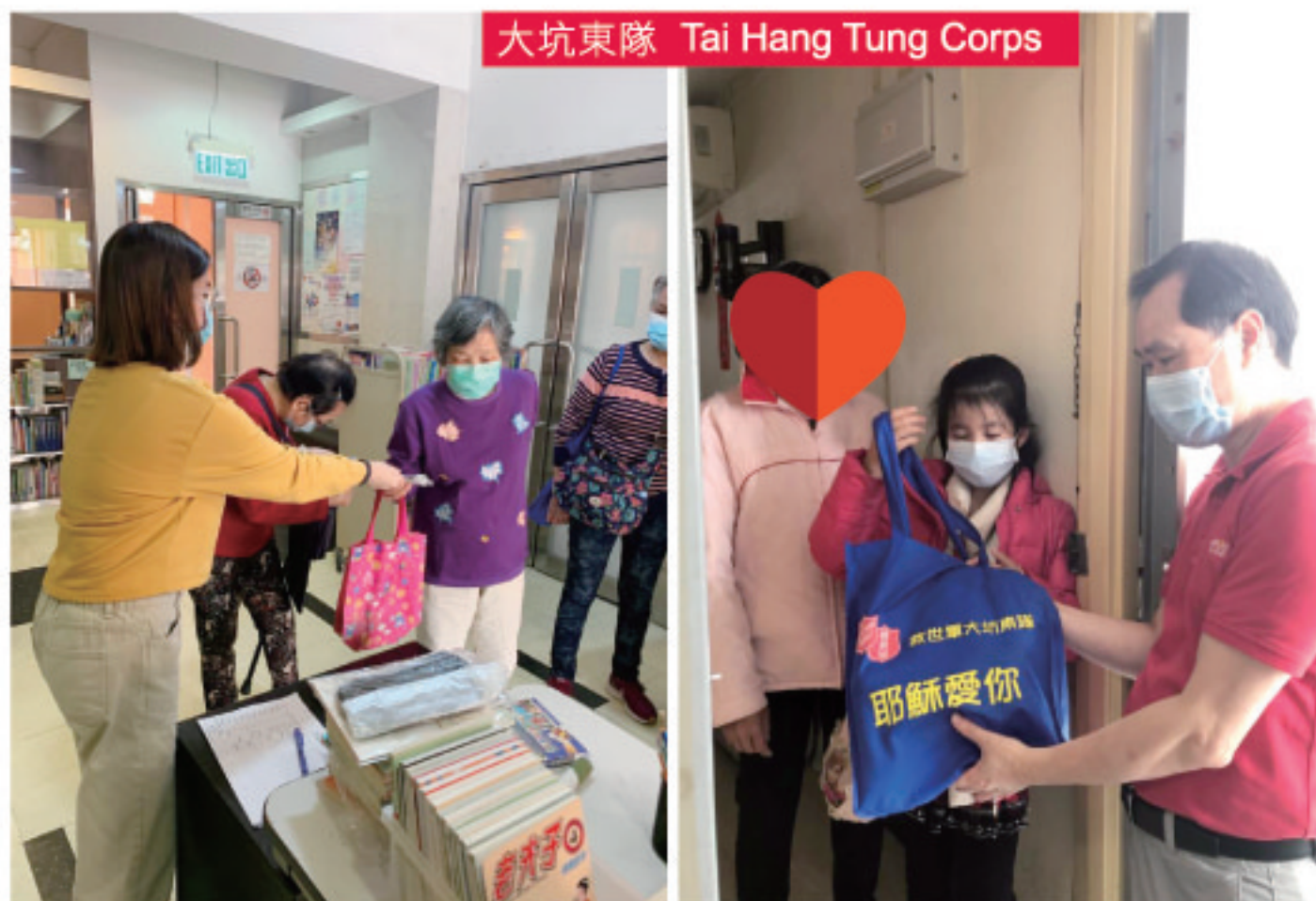
大坑東隊 Tai Hang Tung Corps