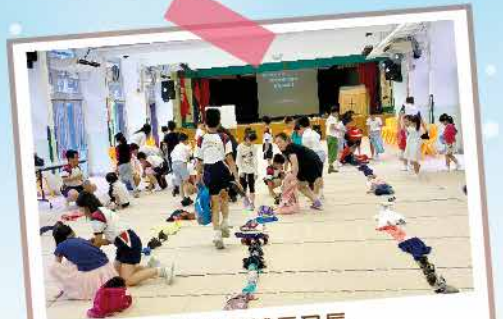
萬里長城長又長 港島東隊Power Kids團契遊戲。