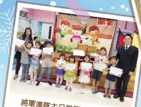
將軍澳隊主日學第一屆畫展。