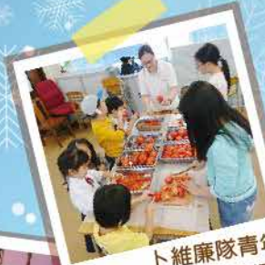
卜維廉隊青年兵支持「援手計劃」 籌款活動並預備食物。