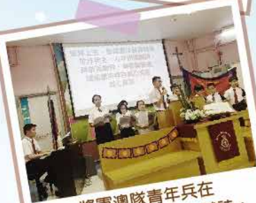
將軍澳隊青年兵在 青年兵主日聖潔會中獻詩。

謝謝你參加親子定向2018 「小野人·綠野·遊踪」 星級再造之旅以支持我們在 香港及澳門的社區關懷服務。