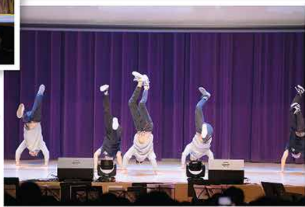
動感街舞 Dynamic Street Dance