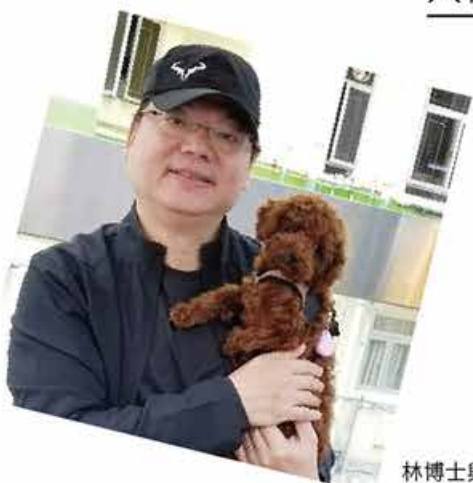
林博士與愛犬合照。