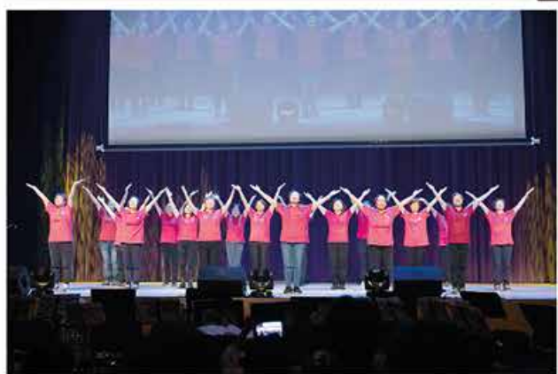
活力讚美操 Dynamic Praise Dance

The Army held the Command Christmas Concert on 7 December 2018. Various units presented music and other performances, sharing the good news of the birth of the Lord Jesus Christ with the audience.