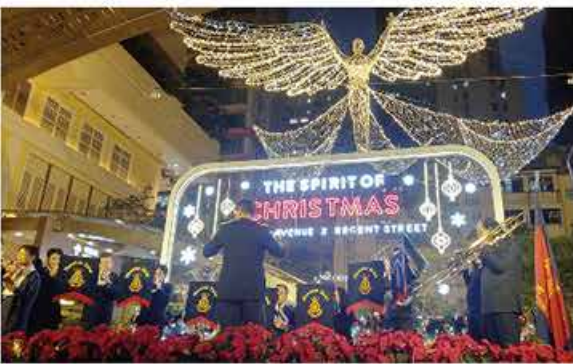
救世軍總部樂隊與詩班在澳門報佳音。 TSA Staff Band and Songsters sang Christmas carols in Macau.