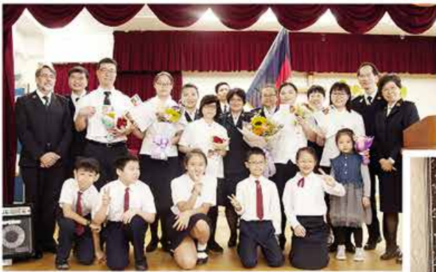
灣仔隊於2018年12月9日在區內報佳音，與坊眾分享主耶穌降生的喜信。 Wanchai Corps sang Christmas carols in the neighbourhood on 9 December 2018, sharing the good news of the birth of the Lord Jesus Christ with the community.