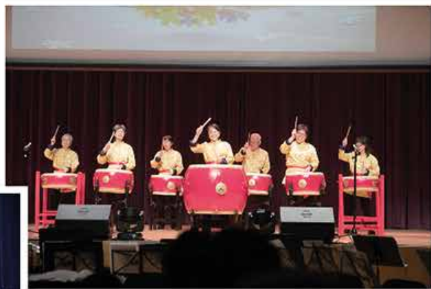
長者鼓樂 Senior Citizens Drumming