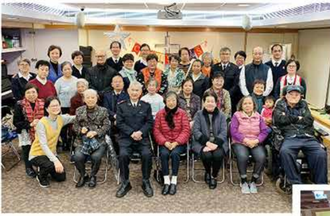
銀星團契及退休軍官於2018年12月10日舉行聖誕聚餐。 Silver Star Fellowship and retired officers held a Christmas party on 10 December 2018.

本軍與長者分享李國寶博士送出的聖誕火雞。 The Army shared with the elders the turkey sponsored by Dr David Li.