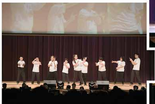
傷健共舞 Inclusive Dance