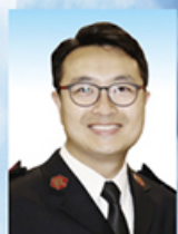
林業鏗中尉 區部青年處主任 將軍澳隊副部隊軍官