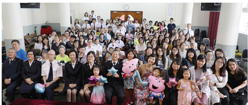
▲ 灣仔隊於9月23日舉行71周年堂慶暨教育主日聖潔會。

Wanchai Corps held the 71 st Anniversary Celebration cum Education Sunday Holiness Meeting on 23 September.