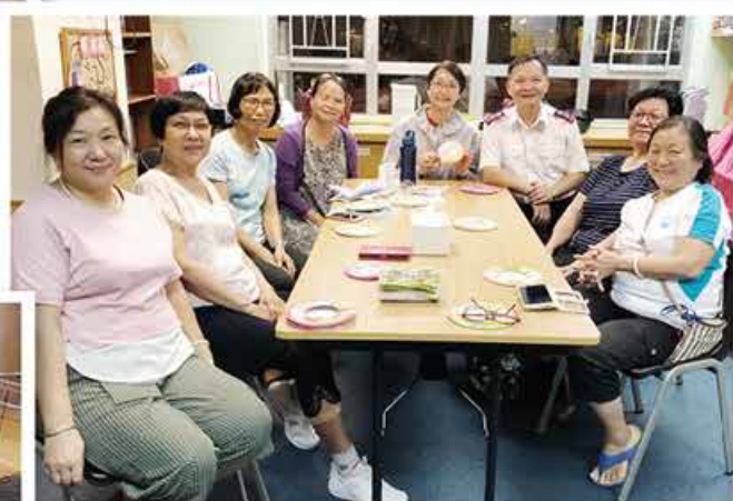
九龍城隊以斯帖團契慶中秋。 Esther Fellowship of Kowloon City Corps celebrated the Mid-Autumn Festival.