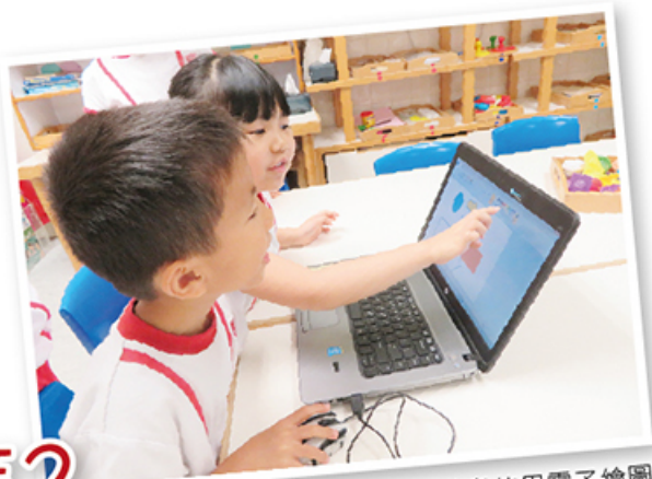
幼兒使用電子繪圖

在學校的學習過程中，有時的而且確需要借助電子產品，例如，當老師與孩子研究小蜜蜂採花蜜的過程時，基於安全考量，教師未能帶孩子親往現場，故確實有需要借助網上的資料或影片，才能滿足孩子的好奇心和他們的探索欲望，以及提升孩子學習的興趣。由此可見，在現代的學習過程中，電子產品也能發揮有效的作用，關鍵是如何教導孩子使用電子產品。