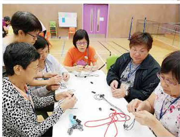
姊妹們在婦女事工營中製作萬用手帶。 Fellow sisters made multi-function wristbands at the Women's Ministries Camp.