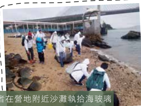
參加者在營地附近沙灘執拾海玻璃