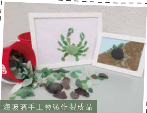
海玻璃手工藝製作製成品

海洋垃圾中，除塑膠垃圾外，海玻璃亦為數不少。海玻璃是指人類丟棄在水中的各種玻璃製品，經過長時間海水、海沙打磨後形成的光滑玻璃殘骸。每當潮退時，海玻璃在長洲及馬灣沙灘舉目皆是，這些旁人眼中已無價值的廢料，反而為營舍服務開拓了一個嶄新的活動——海玻璃手工藝製作。憑着愛惜環境、「轉廢為藝」的信念，營地導師帶着活動參加者，彎着腰，汗流浹背地在沙灘上執拾「寶物」，再造出獨一無二的海玻璃手作。營友在活動中的體會與反思，將有助感染他人，把愛護海洋的訊息傳揚開去。