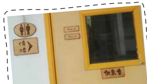
颱風後斷樹幹雕琢為場地指示牌

營舍服務與大自然的關係實在密不可分，利用營地作平台推廣環保亦至為適合。期望營友日後使用營舍服務的時，除了在服務、活動和設施等方面，感受到同工對推廣環保工作的付出外，亦能獲得一點啟發，將其應用到日常生活上。S