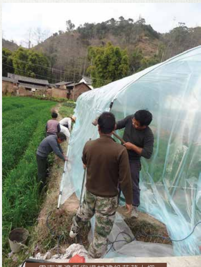
雲南漾濞縣密場村建設蔬菜大棚