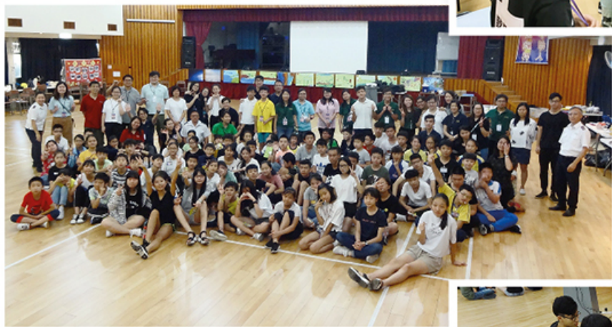
卜維廉隊於8月4日在卜維廉中學舉行「福音遍傳」佈道會。 William Booth Corps held the 'Evangelical Meeting' at William Booth Secondary School on 4 August.