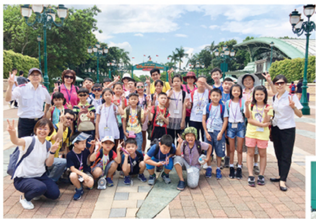
大埔隊暑期聖經班從遊戲中學習聖經(下)，並舉辦戶外樂園之旅(左)。 Tai Po Corps summer bible study class learnt about the bible through play (below) and held an outing at a theme park (left).