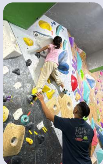
小朋友在教練的指導下，一步一步的向目標攀爬，學習勇於嘗試及面對挑戰。