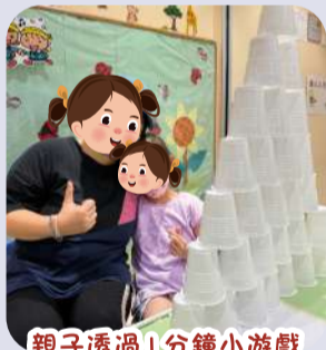
親子透過1分鐘小遊戲挑戰學習「認清目標」的道理。