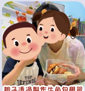
親子透過製作牛角包學習「思想解纏」的道理。