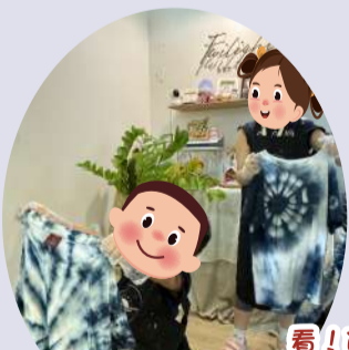
看！這是我們的藍染製成品。