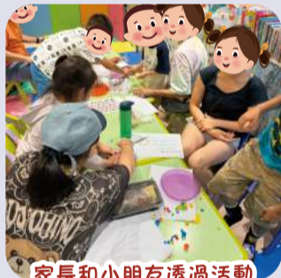
家長和小朋友透過活動學習專注當下。