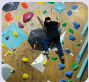
小朋友在教練的指導下，一步一步的向目標攀爬，學習勇於嘗試及面對挑戰。