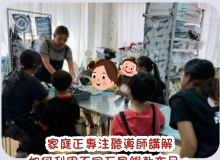
家庭正專注聽導師講解如何利用不同工具綁紮布品。